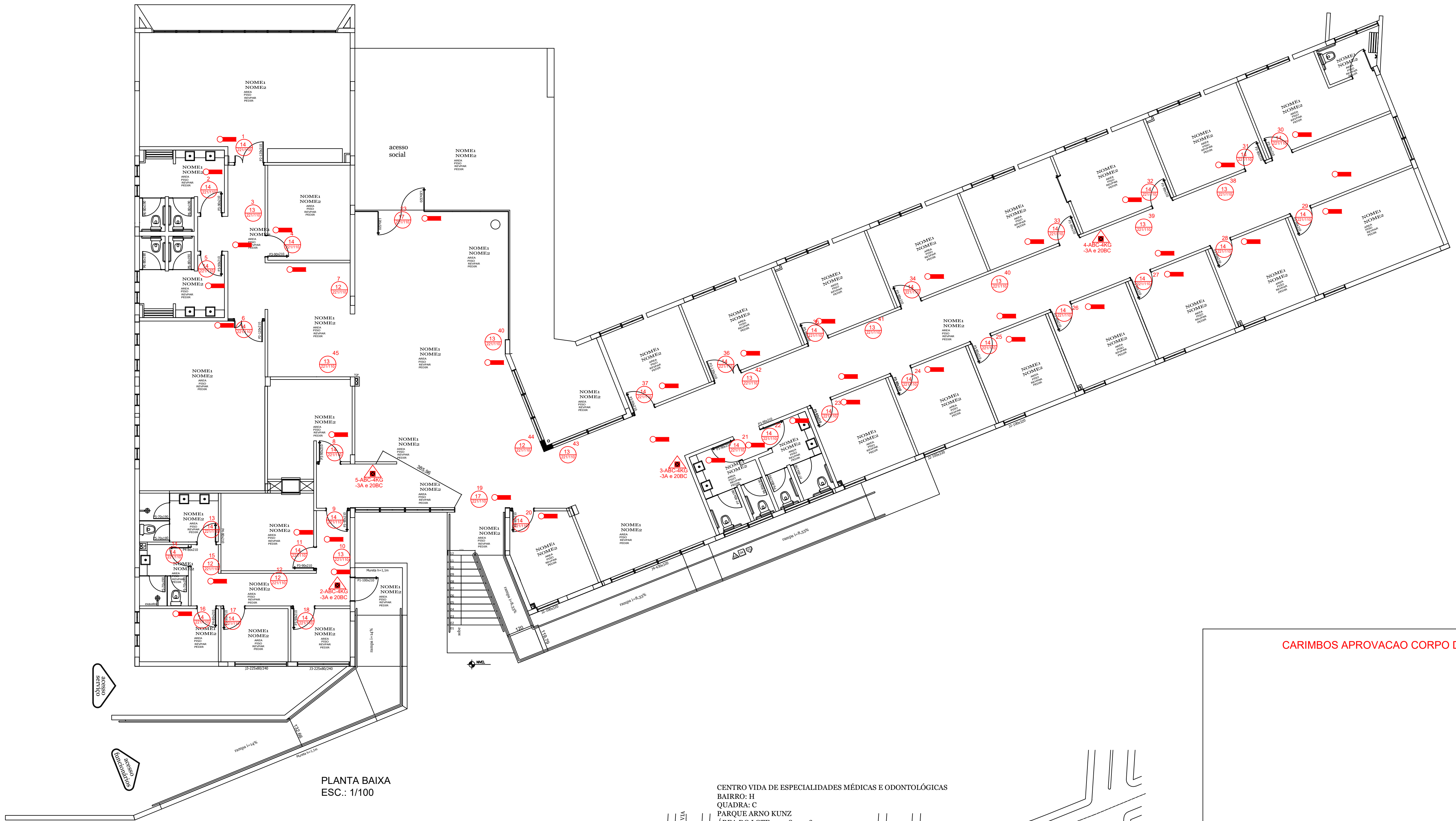
PLANTA BAIXA ESC.: 1/100